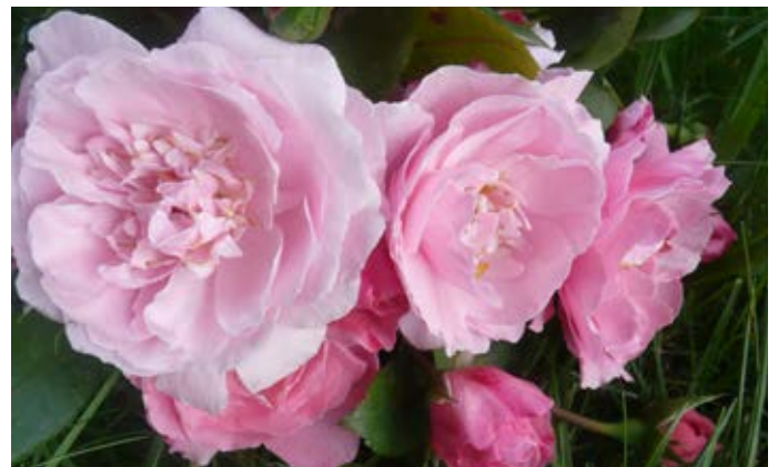
Rose de Bagnoles de l'Orne

Rose de Bagnoles de l'Orne peut être obtenue auprès des pépinières Lecomte présentes à Entre Ville et Jardin et sur internet : www.pepinieres-lecomte.com - au prix de 18,50 euros. (Port en sus)