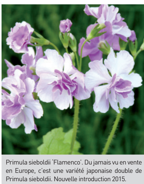
Primula sieboldii 'Flamenco'. Du jamais vu en vente en Europe, c'est une variété japonaise double de Primula sieboldii. Nouvelle introduction 2015.

CONTACT PRESSE | Michèle Fréné Agence Michèle Fréné Conseil - Caen 02 31 75 31 00 - mfc@michele-frene-conseil.fr michele-frene-conseil.fr