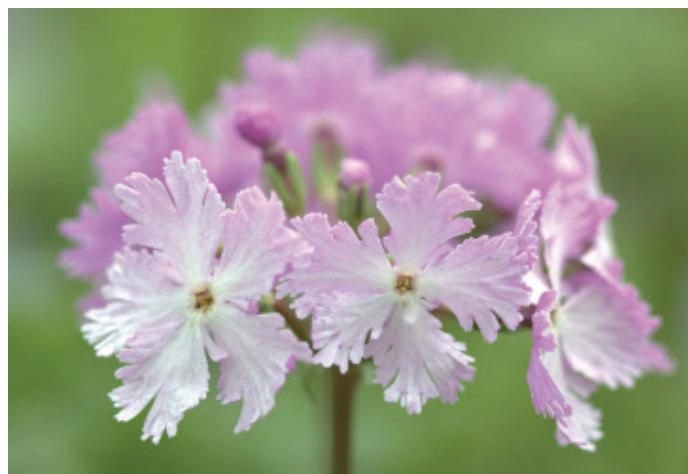
Primula sieboldii 'Dancing ladies'